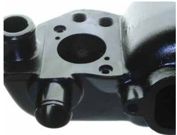
Termostaattikotelon kiinnikke (kotelo mukana)

Huom: Termostaatti sekä anturi ei sisältyä!